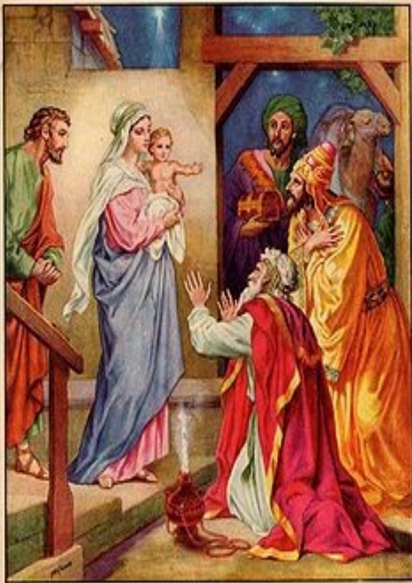
THE VISIT OF THE WISE-MEN

Mit dem Begriff Heilige Drei Könige bezeichnet die christliche Tradition die in der Weihnachtsgeschichte des Matthäus-Evangeliums (Mt 2 EU) erwähnten Weisen aus dem Morgenland, die durch den Stern von Betlehem zu Jesus geführt wurden. Im Neuen Testament werden sie nicht näher beschrieben. Bereits im 3. Jahrhundert entstand jedoch eine umfangreiche Legendenbildung, aus der sich ihre Zahl, ihre Bezeichnung als Könige und - im 6. Jahrhundert - ihre Namen herleiten.