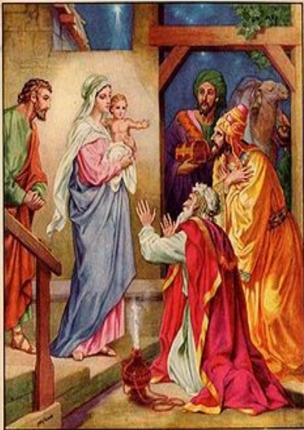
THE VISIT OF THE WISE-MEN

Trzej Królowie, Trzej Mędrcy - według tradycji chrześcijańskiej osoby, które miały podążać za Gwiazdą Betlejemską, przybyć do miejsca urodzin Jezusa Chrystusa. W Nowym Testamencie nie są oni dokładnie opisani. Jedyna informacja o mędrcach znajduje się w Ewangelii Mateusza. Już w 3 stuleciu istnieje przekaz, z którego wywodzi się liczba i imiona Trzech Króli.