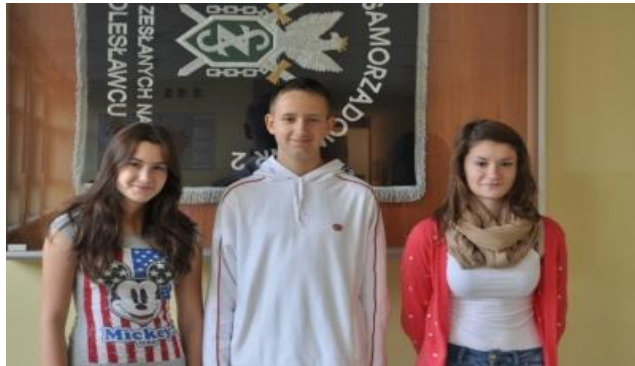
Posłowie na XVIII Sesję Dzieci i Młodzieży

Statystycznie każdy gimnazjalista wzięło udział w 3 konkursach